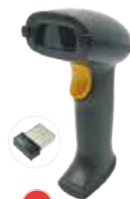
MS838 / MS838B