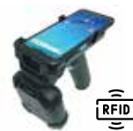
RG768 (PA768 Accessory)