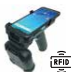
RG768 (PA768 Accessory)