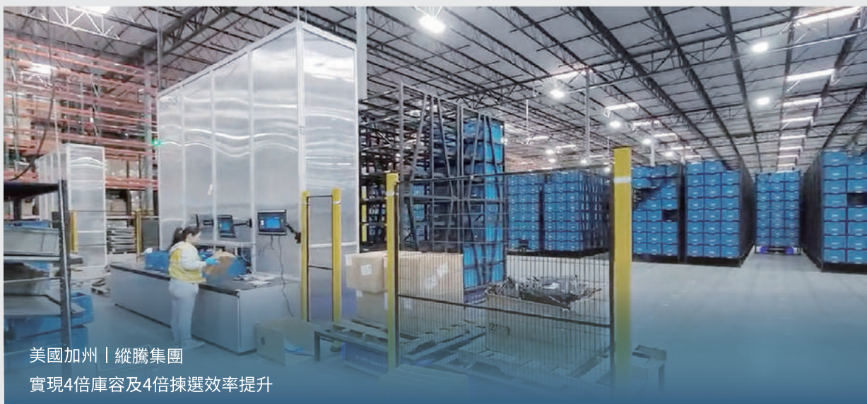
美國加州 | 縱騰集團 實現4倍庫容及4倍揀選效率提升