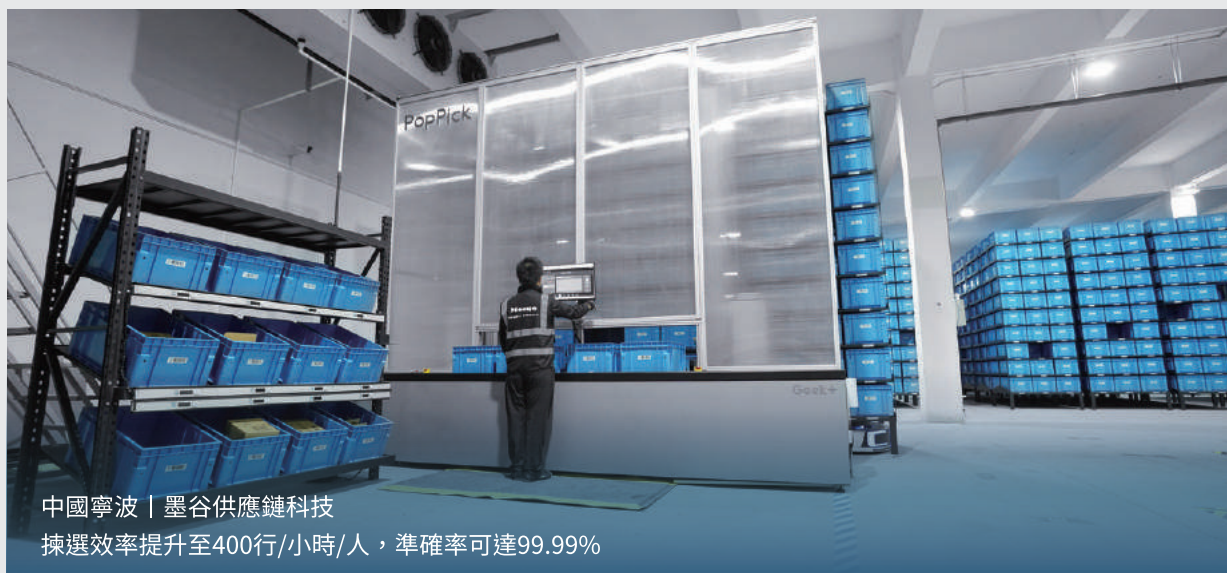
中國寧波 | 墨谷供應鏈科技 揀選效率提升至400行/小時/人，準確率可達99.99%